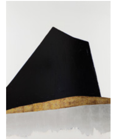
Anna-Eva Bergman, N°15-1976 Nunatak , 1976, acrylique, modeling paste, feuille de métal et cuivre oxydé sur toile, 200 x 150 cm

Entrée payante - Infos : fondationhartungbergman.fr