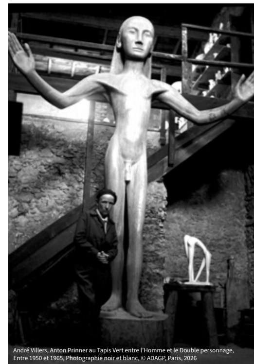
André Villers, Anton Prinner au Tapis Vert entre l'Homme et le Double personnage, Entre 1950 et 1965, Photographie noir et blanc, © ADAGP, Paris, 2026

Entrée payante - Infos: musee@vallauris.fr , 0493641605, Instagram: @museedevallauris