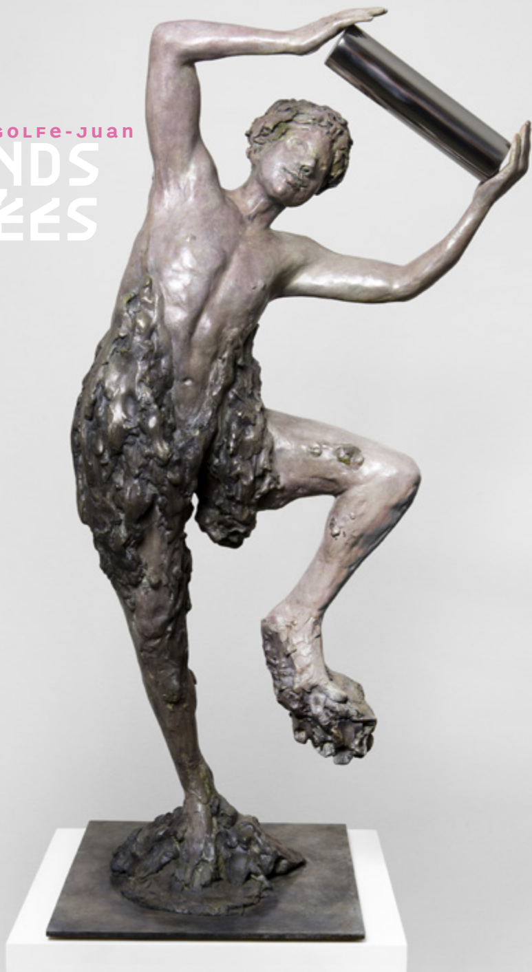
Martial Raysse, Arachée Toi, 2016, Bronze, Collection Fonds de Dotation Martial Raysse