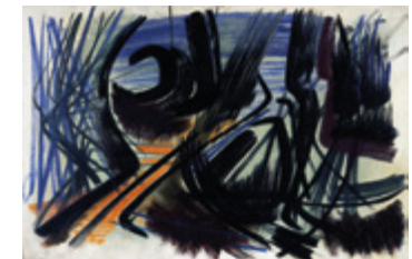
Hans Hartung, T1951-2, 1951 , huile sur toile, 97 x 146 cm