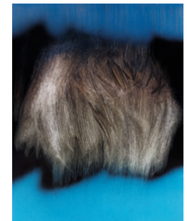
Hans Hartung, T1962-U8, 1962 , vinylique et grattage sur toile, 180 x 142 cm